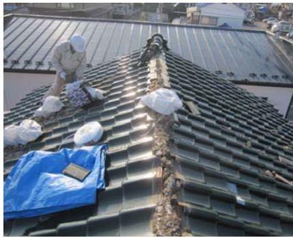
■瓦屋根の応急処置