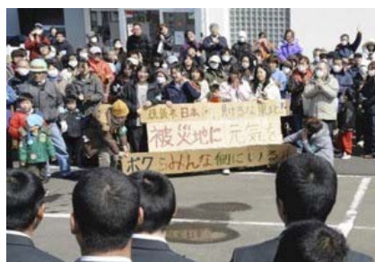
第83回選抜高校野球大会(センバツ) 大会6日目に大垣日大高校(岐阜)と対戦。 惜しくも初戦敗退。