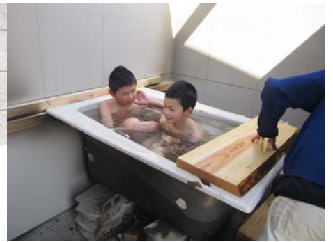
■廃棄の浴槽で“五右衛門風呂”