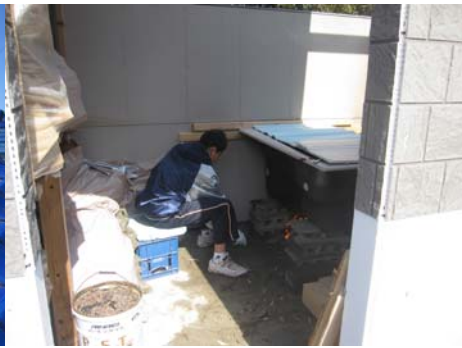
■廃材を薪の代わりに