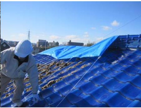
■ブルーシート掛け